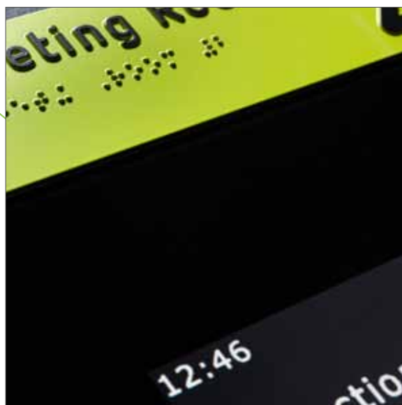
Facility View mit Blindenschrift