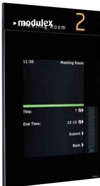
Facility View Interaktiv mit Kopfpaneel