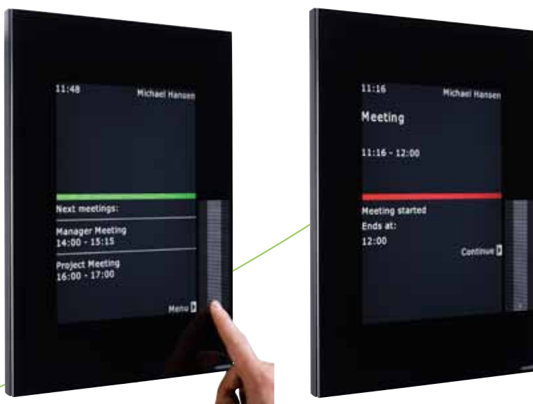
Facility View Interaktiv – Grün bedeutet Buchungen sind möglich oder können hinzugefügt werden – Rot bedeutet besetzt

Die Hintergrundfarbe des Bildschirms ist anpassbar, so dass sie z.B. der Logofarbe des Unternehmens entspricht. Auch die Schriftfarbe kann auf Wunsch geändert werden.